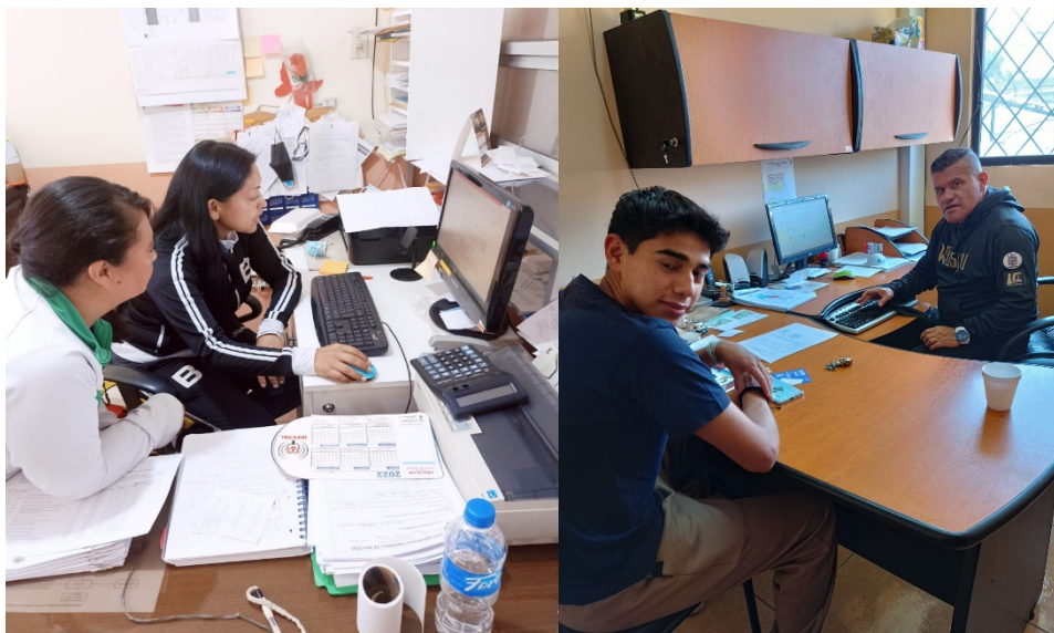
Levantamiento de la información para la evaluación de los organismos cantonales en la zona 3.