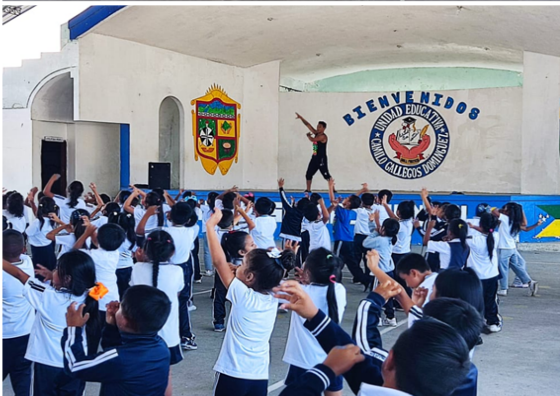
Activación Unidad Educativa Camilo Gallegos Domínguez de la ciudad de Puyo provincia de Pastaza con 253 beneficiarios.