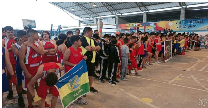
I Open Zonal de Boxeo, cantón La Maná provincia de Cotopaxi participación de 192 deportistas