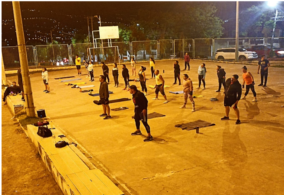
Activación en horario nocturno en el Barrio el Peral de la ciudad de Ambato provincia de Tungurahua con 51 beneficiarios.