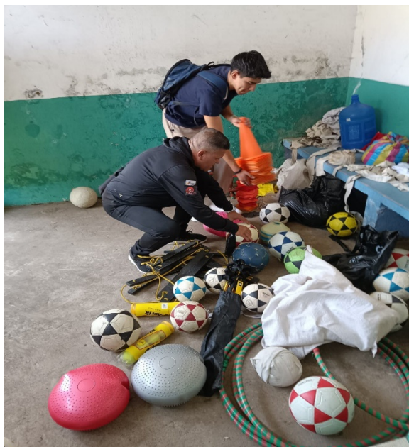
Verificación de la implementación deportiva existente en los escenarios deportivos donde se practica el deporte formativo (Ligas Deportivas Cantonales), en la C23.