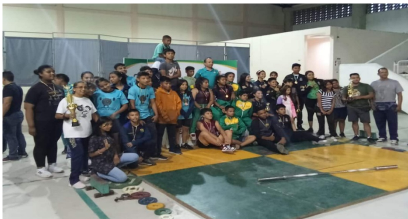
II Open Zonal de Halterofilia, cantón Mera provincia de Pastaza participación de 110 deportistas