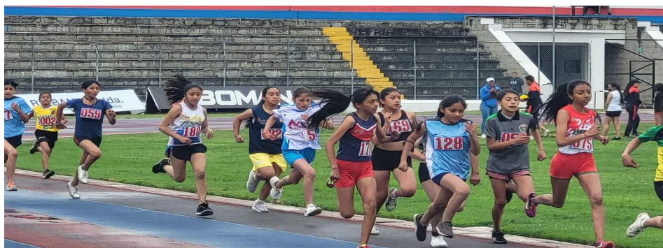
I Open Zonal de Atletismo, cantón Riobamba provincia de Chimborazo participación de 220 deportistas