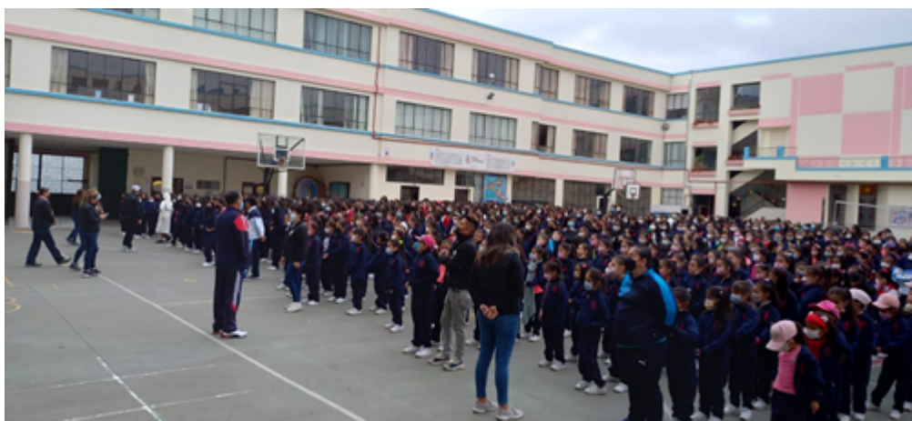
Activación Unidad Educativa María Auxiliadora de la ciudad de Riobamba, con 1200 beneficiarios.