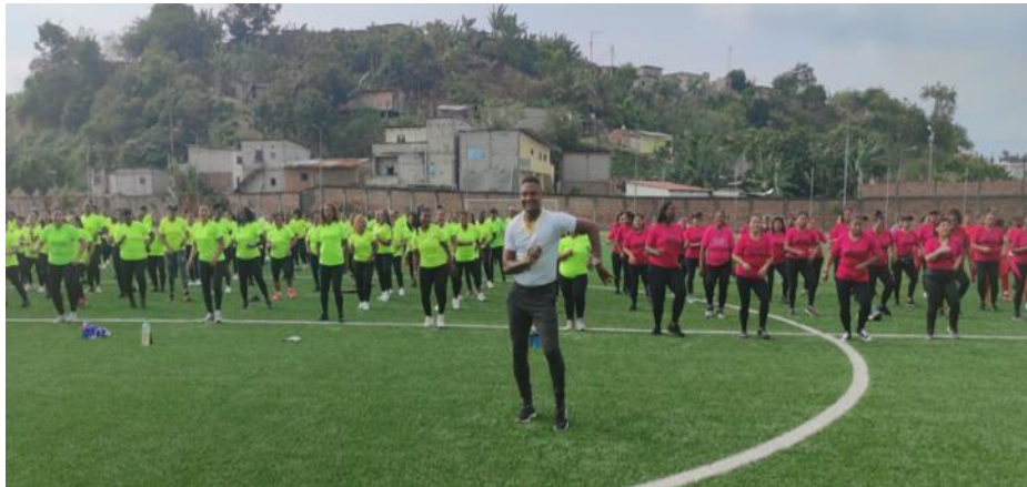
Imagen Nro. 06

En este sentido, en lo que corresponde a la Coordinación Zonal 1, en el Complejo Deportivo “San Rafael”, se realizaron actividades de bailo terapia, circuitos de Crossfit, entre otras, lo cual contó con la participación de 500 personas (imágenes Nro. 6, Nro. 7 y Nro. 8).