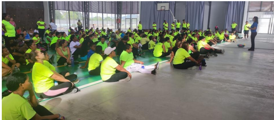
Imagen Nro. 01

Capacitación en nutrición y alimentación saludable - Complejo Deportivo San Rafael