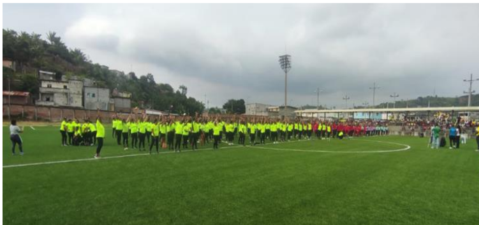
Imagen Nro. 07