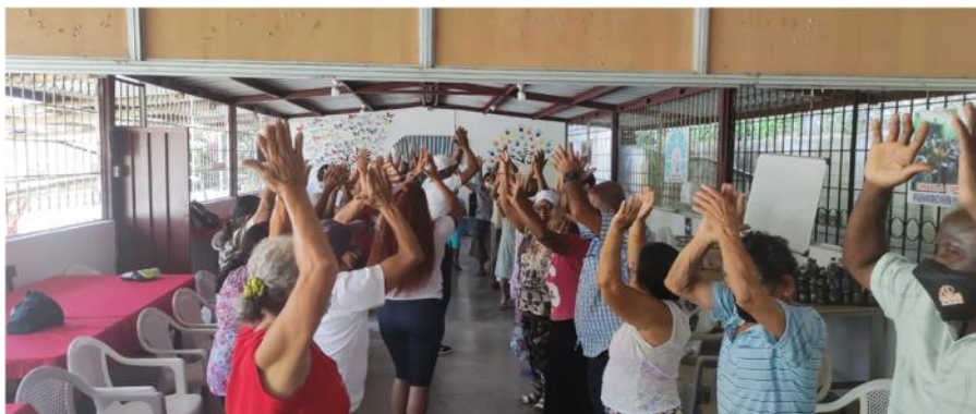
Imagen Nro. 04