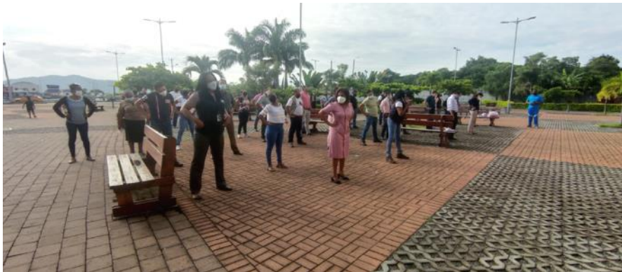
Imagen Nro. 03

Las Palmas contando con la participación aproximadamente de más de 100 personas (imágenes Nro. 3, Nro. 4 y Nro. 5).