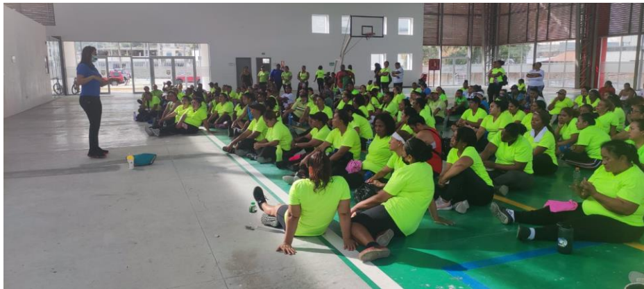
Imagen Nro. 02