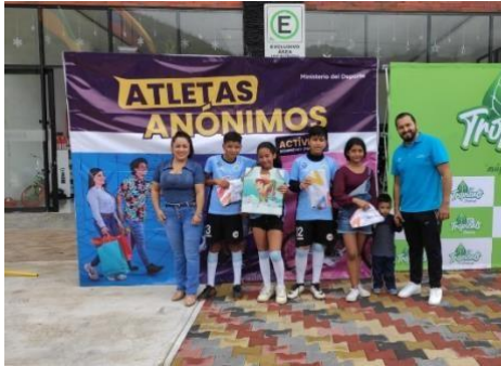
1. Juegos recreativos evento Atletas Anónimos