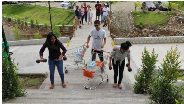
2. Juegos recreativos evento Atletas Anónimos