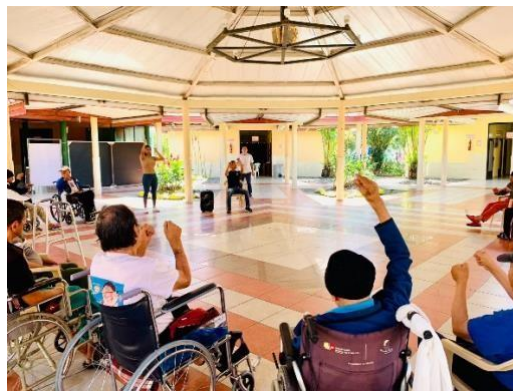
3. Cierre SEA cantón Zamora