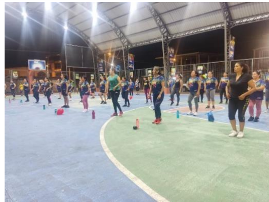
2. Cierre SEA cantón El Guabo