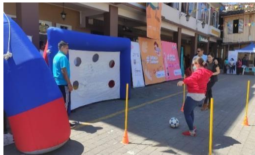
2. Feria Infancia con Futuro Zaruma