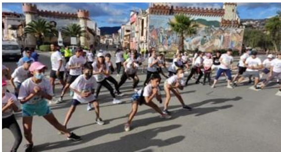
Bailomaratón 5k Loja (200 part.)