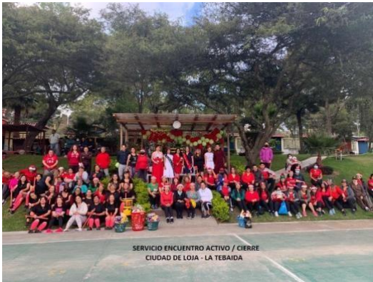
1. Cierre SEA cantón Loja