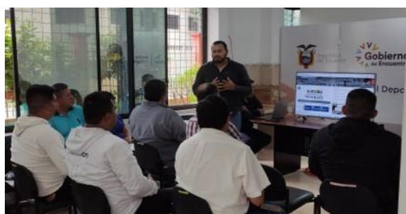
Capacitación a Organismos Deportivos (32 org.)