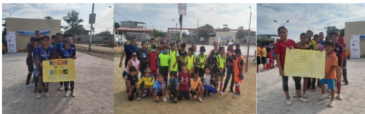
Niños beneficiarios del Proyecto HINCHA de Mi Barrio en el cantón Huaquillas