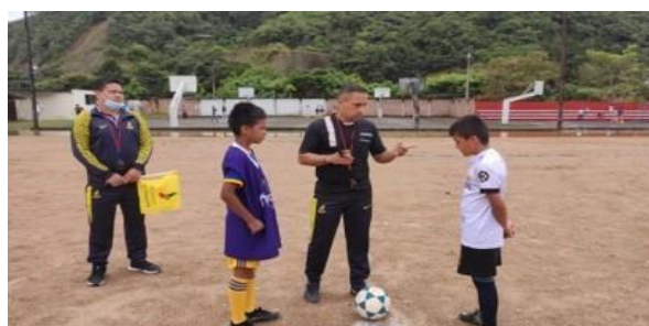
Interescolar de Fútbol Zamora (150 dep.)