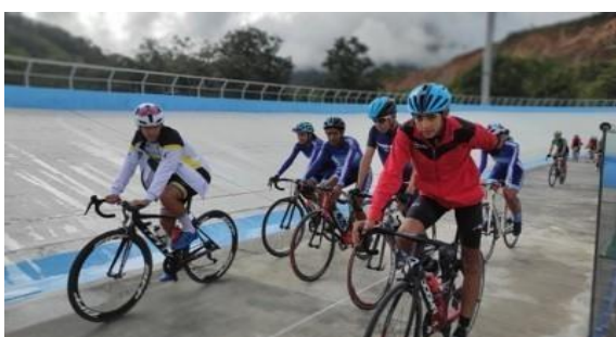
Nacional de Ciclismo Zamora (150 dep.)