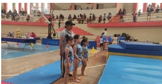
Interescolar de Gimnasia El Pangui (60 dep.)