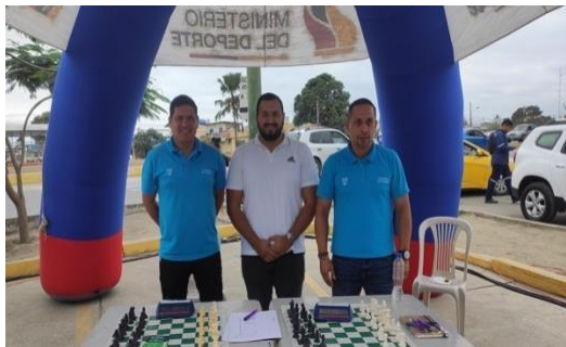
1. Feria Infancia con Futuro Huaquillas

De acuerdo a la planificación elaborada por la Secretaría Técnica Ecuador Crece Sin Desnutrición Infantil, la Coordinación Zonal 7 participó en 8 ferias a través de juegos lúdicos – recreativos en los cantones Limón Indanza, Huaquillas, Zamora, Loja, Gonzanamá, Pindal, Quilanga, Zaruma), espacio que permitió acercar los servicios y atenciones del Estado a la ciudadanía como parte de la Estrategia Ecuador Crece Sin Desnutrición Infantil. A través de las Ferias Infancia Con Futuro, como Cartera de Estado logramos atender a más de 2000 personas entre niños, niñas, jóvenes y adultos mayores.