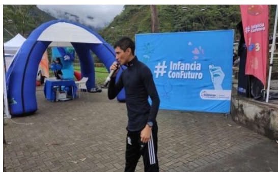
2. Feria Infancia con Futuro Zamora