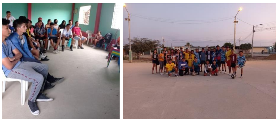
Niños beneficiarios del Proyecto HINCHA de Mi Barrio en el cantón Machala