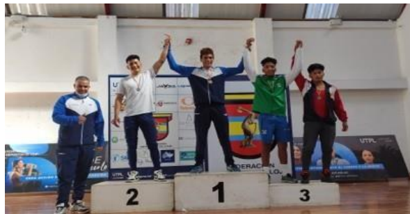
Nacional de Lucha Loja (280 dep.)