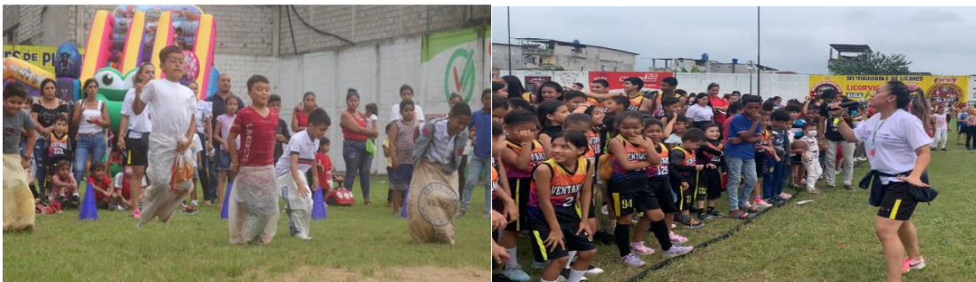
Imagen Nro. 11