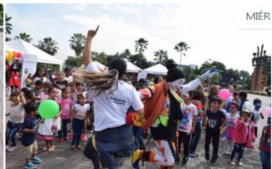
Imagen Nro. 6