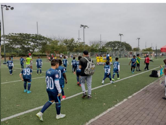
Imagen Nro. 27