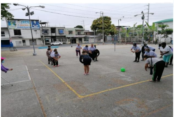
Imagen Nro. 19