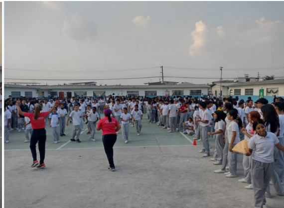
Imagen Nro. 2