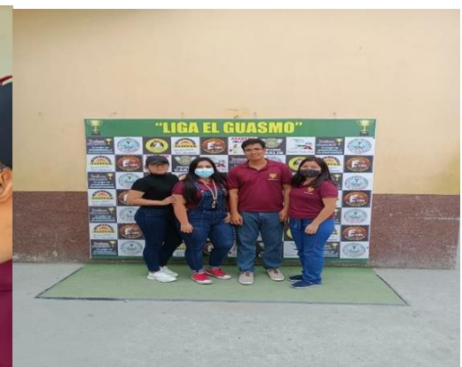
Imagen Nro. 35