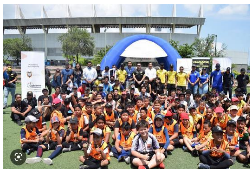
Imagen Nro. 22