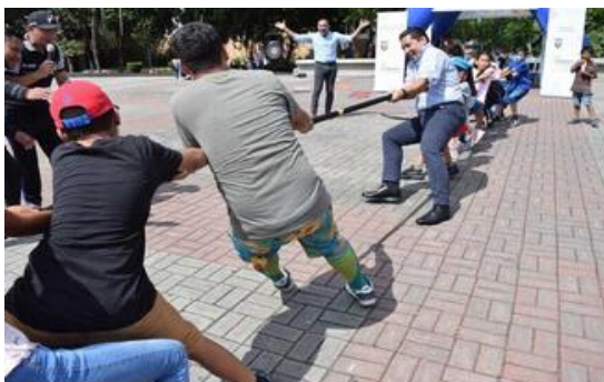
Imagen Nro. 5