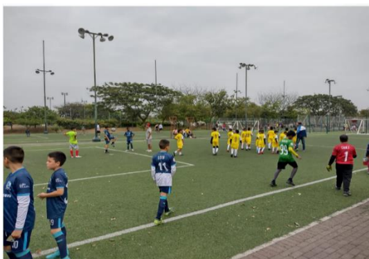
Imagen Nro. 24