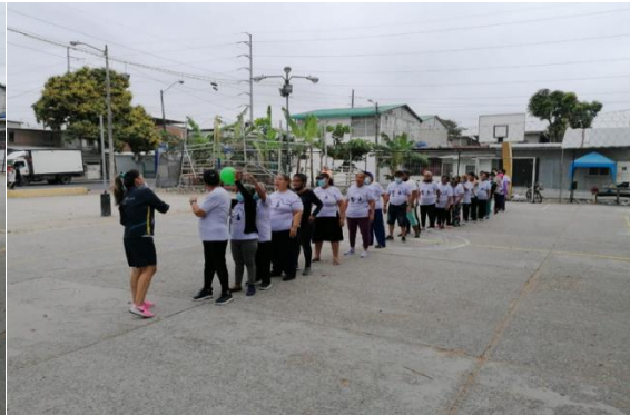
Imagen Nro. 18