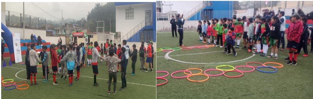
Imagen Nro. 9