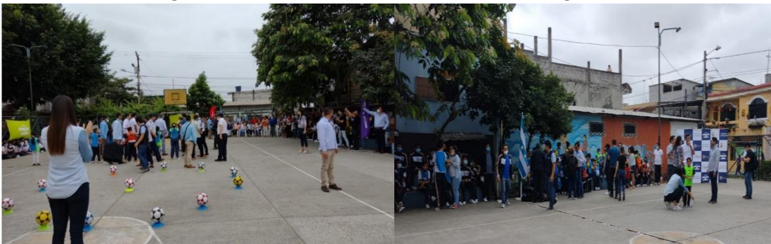
Imagen Nro. 15