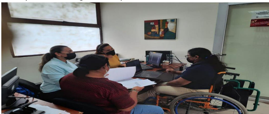
Imagen Nro. 38