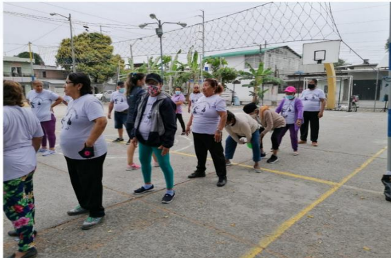
Imagen Nro. 20