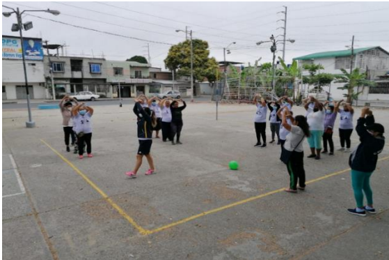
Imagen Nro. 17