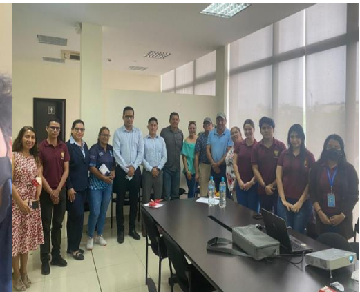
Imagen Nro. 33