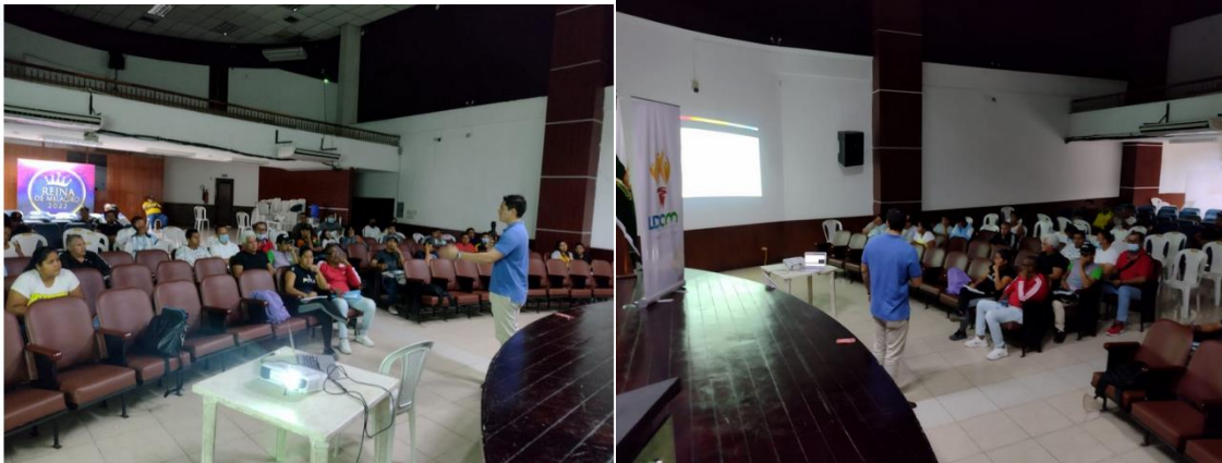
Imagen Nro. 28