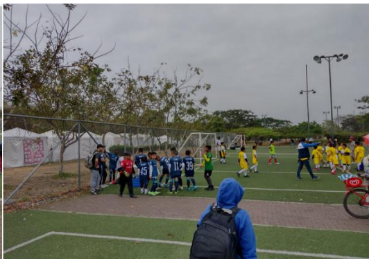
Imagen Nro. 25