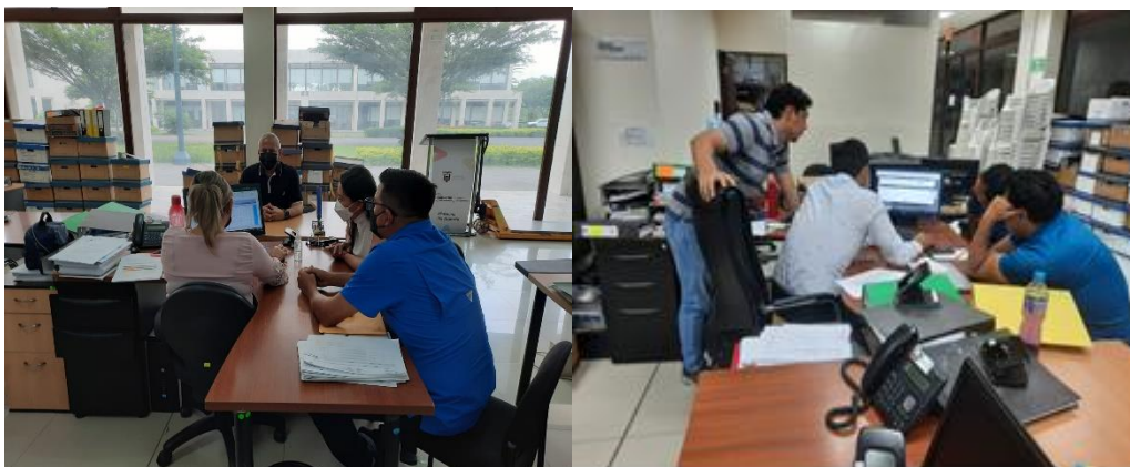
Imagen Nro. 36