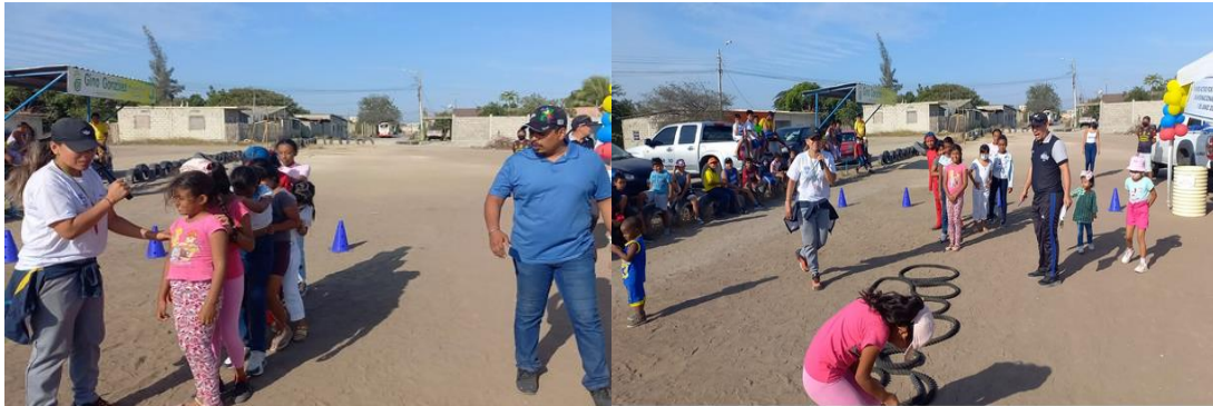
Imagen Nro. 7