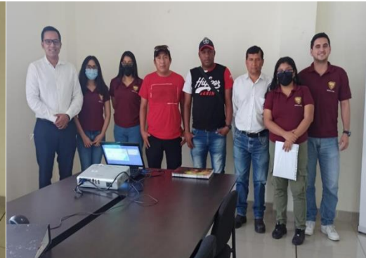
Imagen Nro. 31