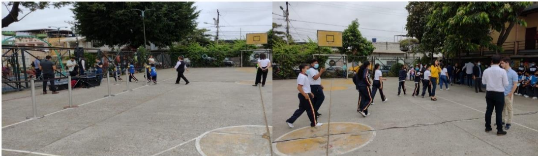
Imagen Nro. 13