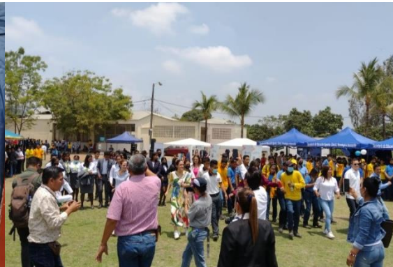
Imagen Nro. 4