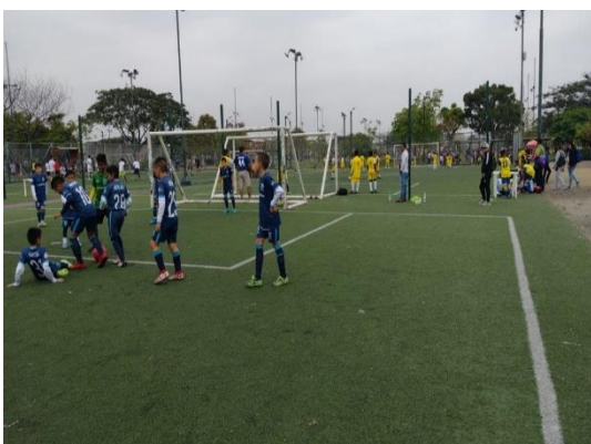
Imagen Nro. 26