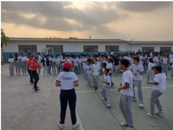
Imagen Nro. 1