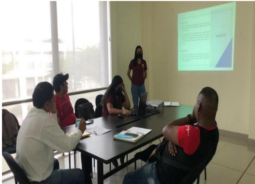
Imagen Nro. 30