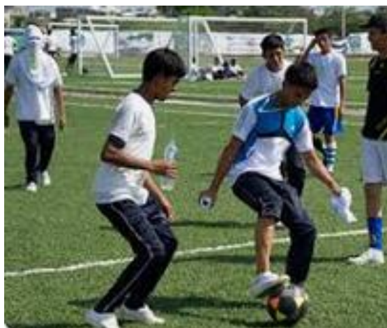
Imagen Nro. 23