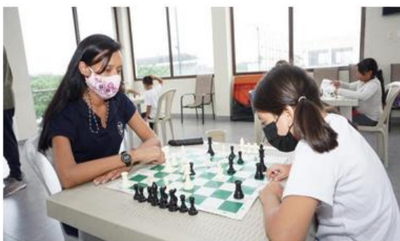
Imagen Nro. 21