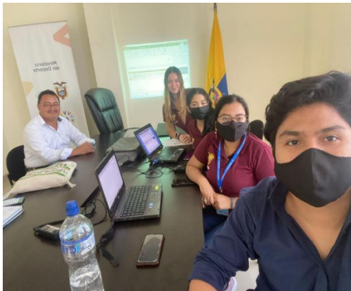
Imagen Nro. 32