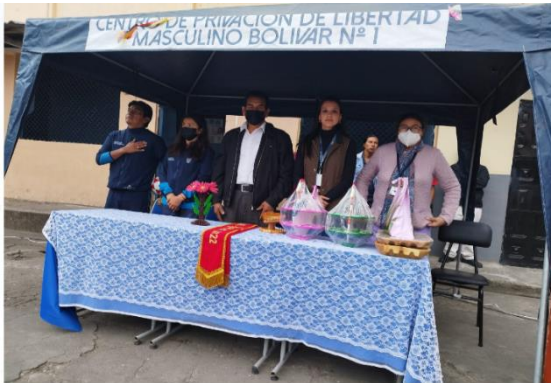
Imagen Nro. 3