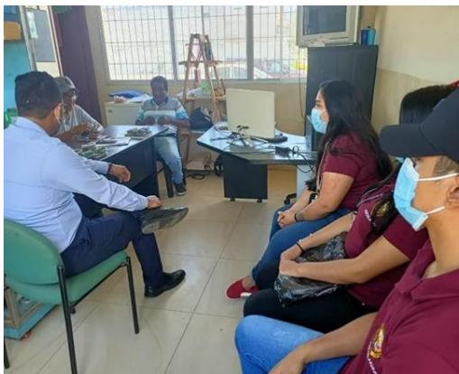
Imagen Nro. 34