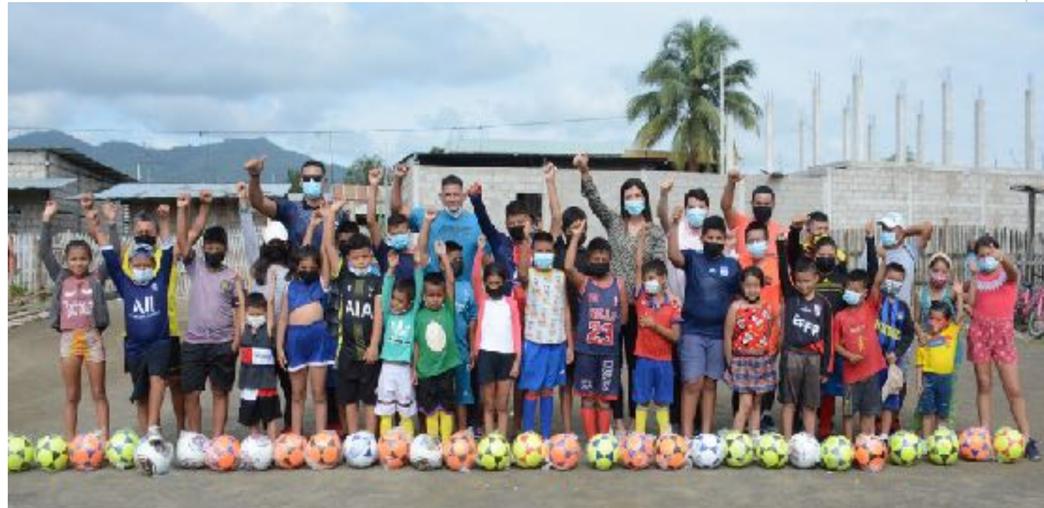
ENTREGA DE IMPLEMENTACIÓN DEPORTIVA.