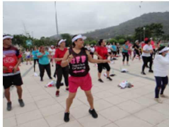
Coordinación Zonal 4 del Deporte