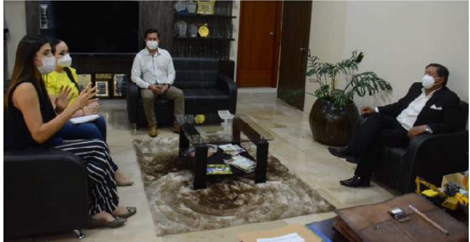
VISITAS A LOS ORGANISMOS DEPORTIVOS DE MANABÍ Y SANTO DOMINGO DE LOS TSÁCHILAS