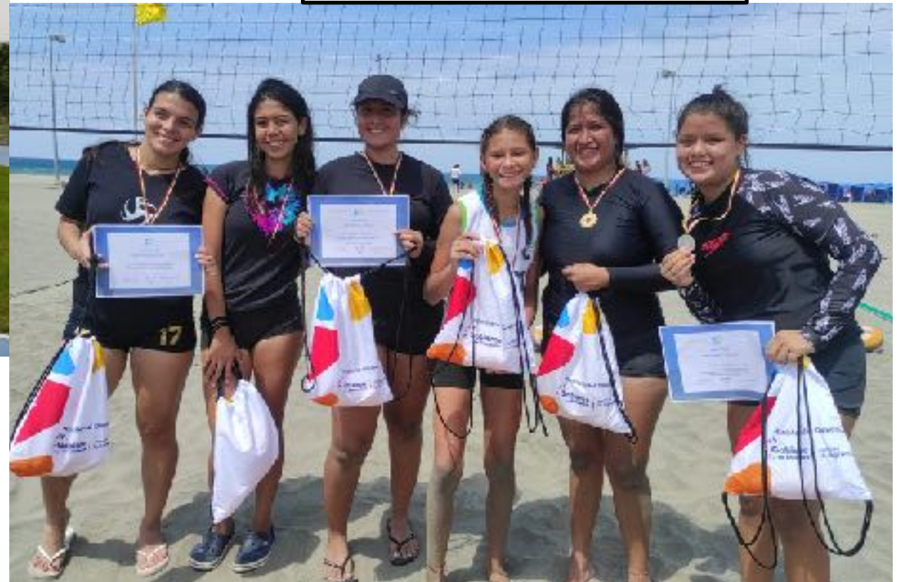
APOYO LOGÍSTICO A EVENTOS DEPORTIVOS