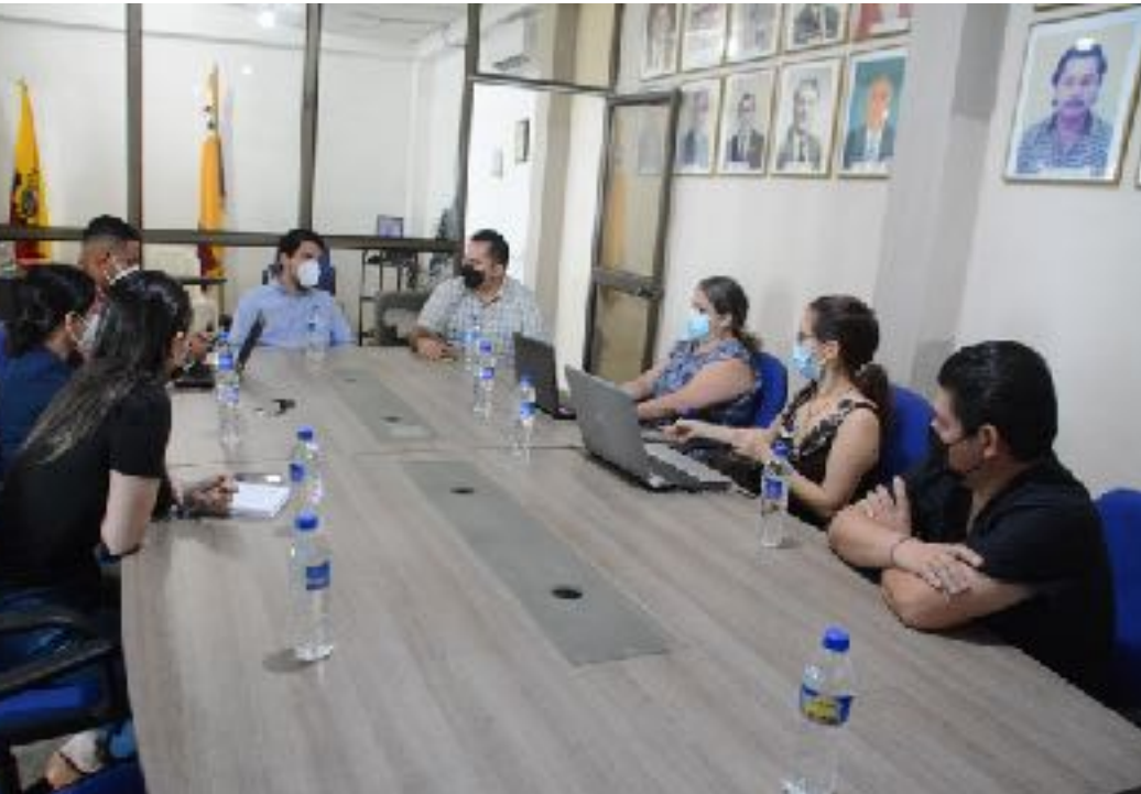
REUNIONES CON ORGANISMOS DEPORTIVOS DE LA ZONA – 4.