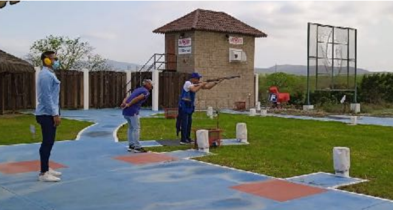
VISITAS DE INSPECCIÓN TÉCNICA A CLUBES