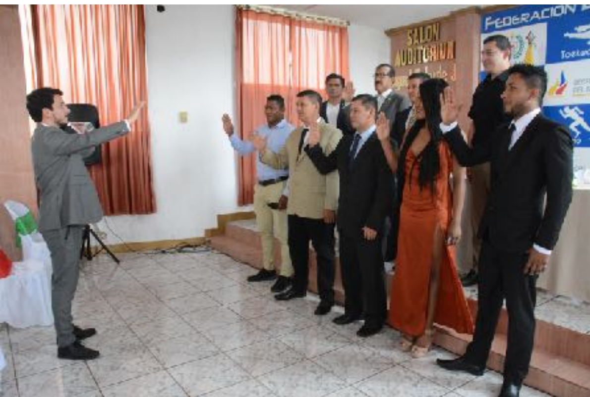
POSESIÓN DEL NUEVO DIRECTORIO DE LA FEDERACIÓN DEPORTIVA DE SANTO DOMINGO DE LOS TSÁCHILAS