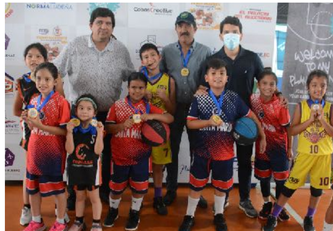
FESTIVAL NACIONAL U10 DE MINIBALONCESTO DESARROLLADO EN SANTO DOMINGO DE LOS TSÁCHILAS