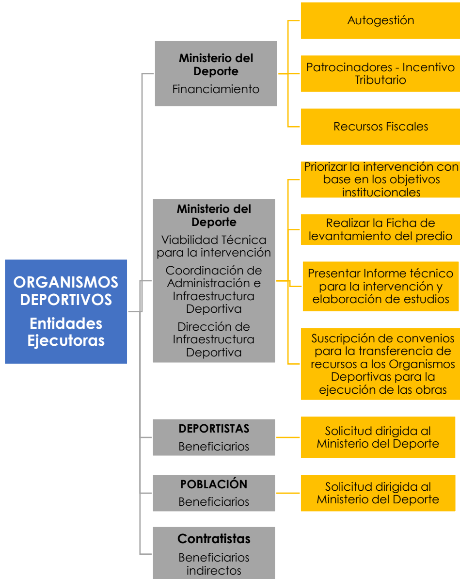
Gráfico 5: Estructura operativa del Ministerio del Deporte para la ejecución del proyecto